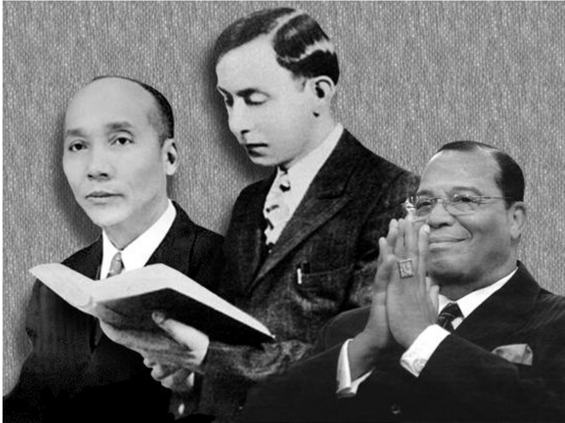
Le Sauveur – Maître Fard Muhammad (centre)